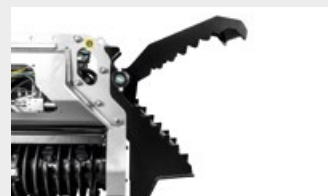
(Houe double) Éperon excavateur et pouce hydraulique permet de déplacer le matériau à broyer