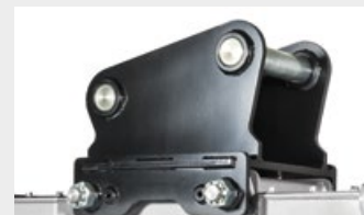
Plaque d'attache avec axes